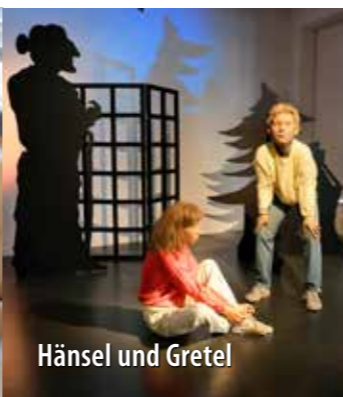
Hänsel und Gretel