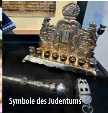
Symbole des Judentums