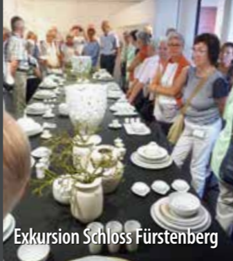
Exkursion Schloss Fürstenberg